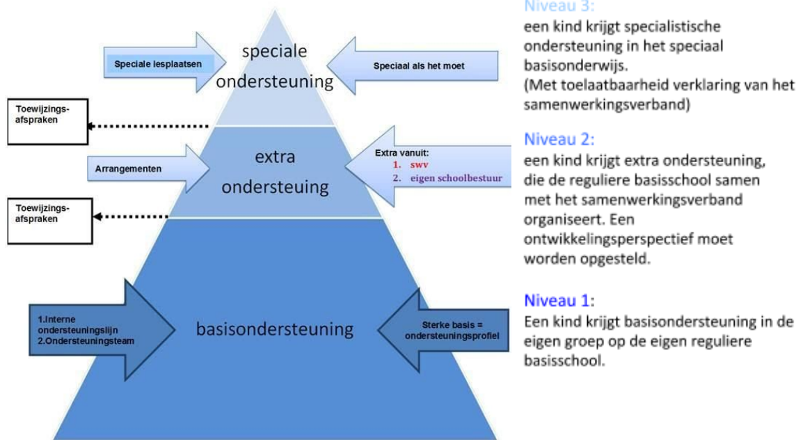
Afbeelding 1: uit Schoolondersteuningsprofiel VJN 2017